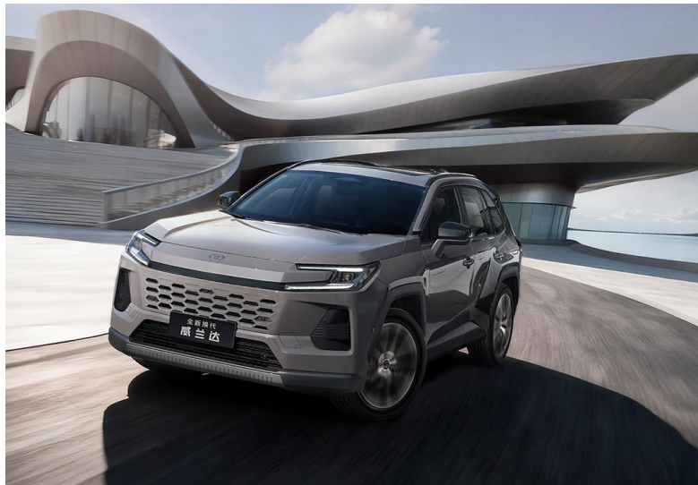
新型「WILDLANDER」 ※本画像は广汽トヨタの許諾を受け掲載しております。 本画像の他への転載、転用を一切禁止致します。