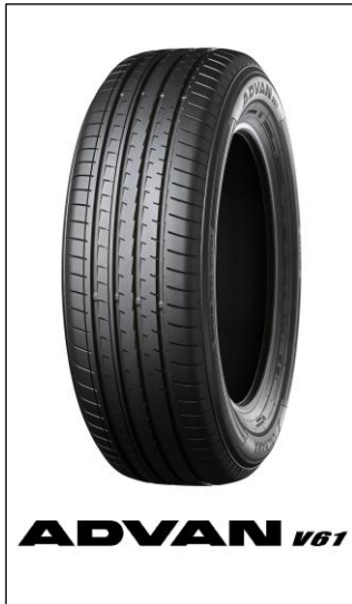
※画像は新型「WILDLANDER」の装着サイズとは異なります。