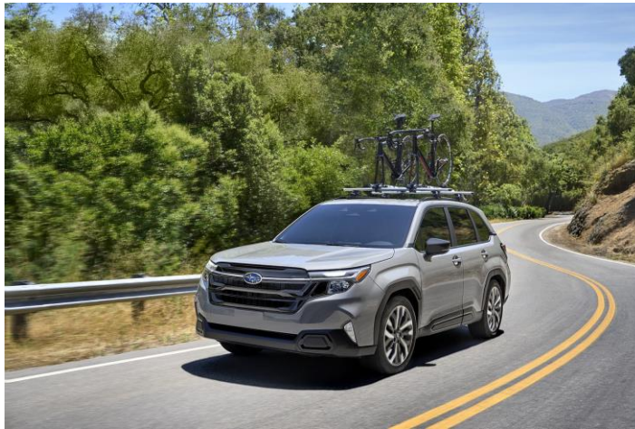
新型「フォレスター」