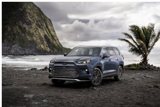
トヨタ「グランドハイランダー」

※本画像はトヨタ自動車（株）の許諾を受け掲載しております。 本画像の他への転載、転用を一切禁止致します。