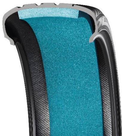
「SILENTFOAM」の装着イメージ (SILENTFOAM は実際には青色ではありません。)