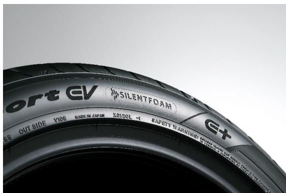
タイヤサイドに施された「SILENTFOAM」と 「E+」マークの刻印