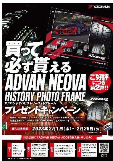
キャンペーンの告知ビジュアル

横浜ゴムは、2021年度から2023年度までの中期経営計画「Yokohama Transformation 2023（YX2023）」（ヨコハマ・トランスフォーメーション・ニーゼロニーサン）のタイヤ消費財事業において、高付加価値商品の主力であるグローバルフラッグシップタイヤブランド「ADVAN」、SUV・ピックアップトラック用タイヤブランド「GEOLANDAR」、そして「ウィンタータイヤ」の販売構成比率最大化を掲げています。