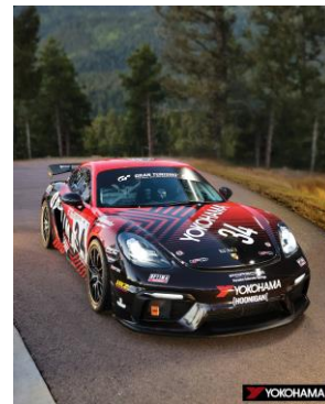
Tanner Foust 選手が駆る 「2020 Porsche 718 Cayman GT4 Clubsport」