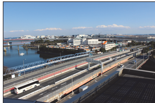
首都高速道路1号線

このリリースに関するお問い合わせ先 横浜ゴム（株）広報部 担当：池田 TEL：03-5400-4531 FAX：03-5400-4570