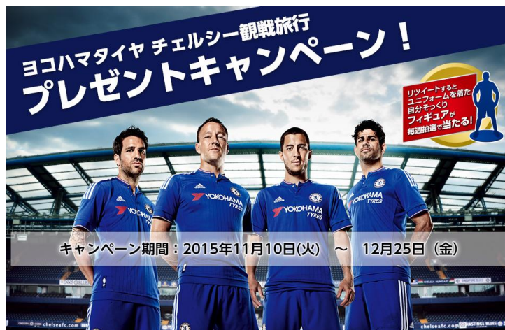
「ヨコハマタイヤ チェルシー観戦旅行プレゼントキャンペーン」の広告

このほか、横浜ゴムの公式 Twitter アカウント (@YokohamaRubber) がツイートする「ヨコハマタイヤ チェルシー観戦旅行プレゼントキャンペーン」に関する情報をリツイートすると、抽選で毎週1名様に、ご自身がチェルシーのユニフォームを着たオリジナルの3Dフィギュアをプレゼントする。