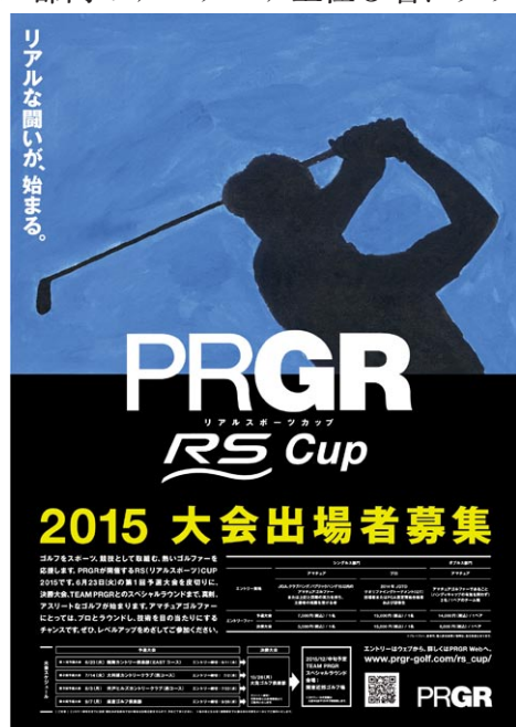
「PRGR RS CUP」のポスター

予選大会は6月から9月にかけて鶴舞カントリー倶楽部、大利根カントリークラブ、宍戸ヒルズカントリークラブ、麻倉ゴルフ倶楽部の会場で4回開催する。予選を勝ち抜いたシングルス部門80名（アマチュア・プロ合計）、ダブルス部門20組が10月26日に大洗ゴルフ倶楽部で決勝大会を戦う。なお、12月開催予定のスペシャルラウンド（会場・日程は未定）には、決勝大会のシングルス部門のアマチュア上位3名、ダブルス部門上位3組を招待する。