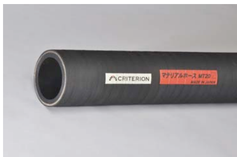
マテリアルホース (MT20)