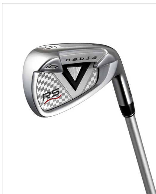
iD nabla RS TITAN FACE アイアン（#5）

「iD nabla RS TITAN FACE アイアン」はチタンフェースのキャビティアイアン。「構えやすさ」「シャープな顔」などの感性を重視し、ミッドサイズのセミダースヘッドでトゥ側が高いアイアンらしい形状を採用した。さらに「飛びとやさしさ」を追求し、フェース素材に、#5～#9では弾きの大きいチタンを採用（Pw、Aw、Swはソフトステンレス）したほか、ロフトもややストロングロフト（#5：24°）に設計。チタンフェースでもソフトな打感にこだわり、ヘッド内に振動吸収剤を充填することで今までのチタンフェースにないソフトな打感を実現している。また、タングステンウェイトをソール部に配置（#5～#9）した低重心設計でやさしさも追求している。