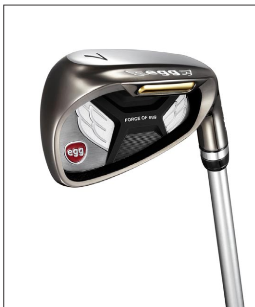
NEW egg IRON (#7)

「egg」ブランドのクラブは「既成概念にとらわれない」「卵の殻を打ち破る発想」「飛び、やさしさを最優先」をコンセプトに開発している。「NEW egg IRON」以外にも“飛び”を追求した新しい「egg」として9月から順次、フェアウェイウッド、ドライバー、ユーティリティを発売する。