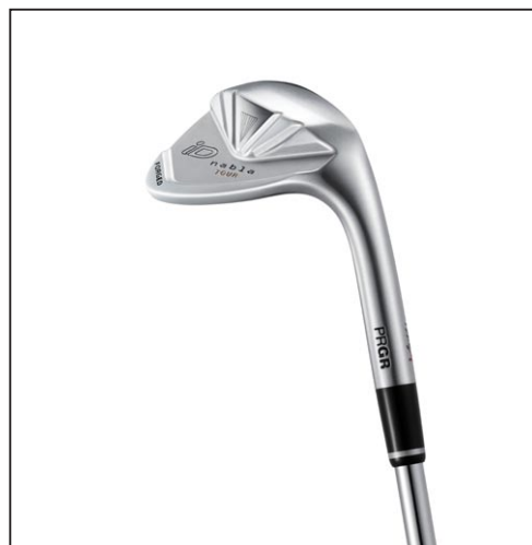
iD nabla TOUR WEDGE (Type A)