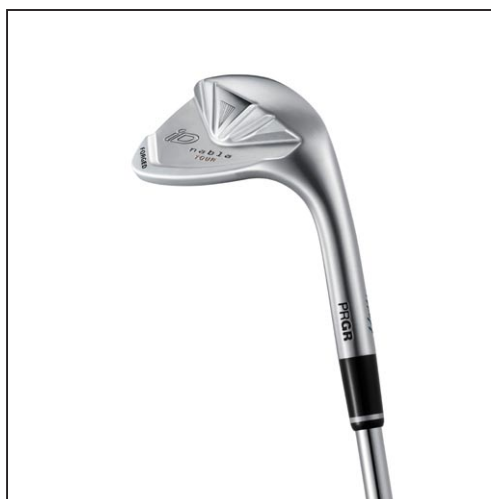
iD nabla TOUR WEDGE (Type H)

「iD nabla」シリーズはアスリートモデルの「iD nabla BLACK」、アベレージモデルの「iD nabla X」、エグゼクティブ・シニア向けの「iD nabla RED」を発売している。今回、プロ・アスリートモデルとして「iD nabla TOUR WEDGE」「iD nabla TOUR IRON」を発売することで、ゴルファーのスキル、プレースタイルにより幅広く応えられるラインアップとなった。