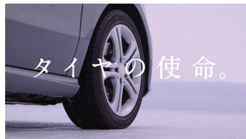
テレビCMのワンシーン