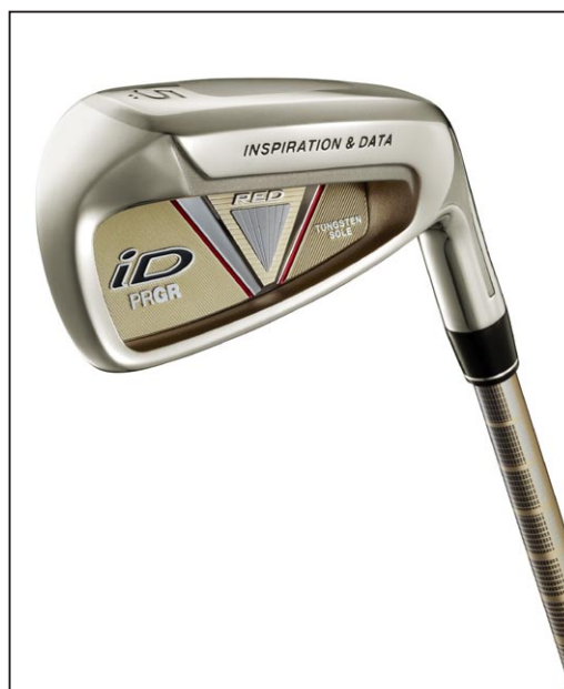
iD nabla RED アイアン（#5）

「iD nabla」シリーズはすでに、アスリートモデルの「iD nabla BLACK」、アベレージモデルの「iD nabla X」をラインアップしている。今回、シニア向けとして従来から好評だった赤（RED）モデルを「iD nabla」シリーズに復活させることで、より充実したラインアップとなった。