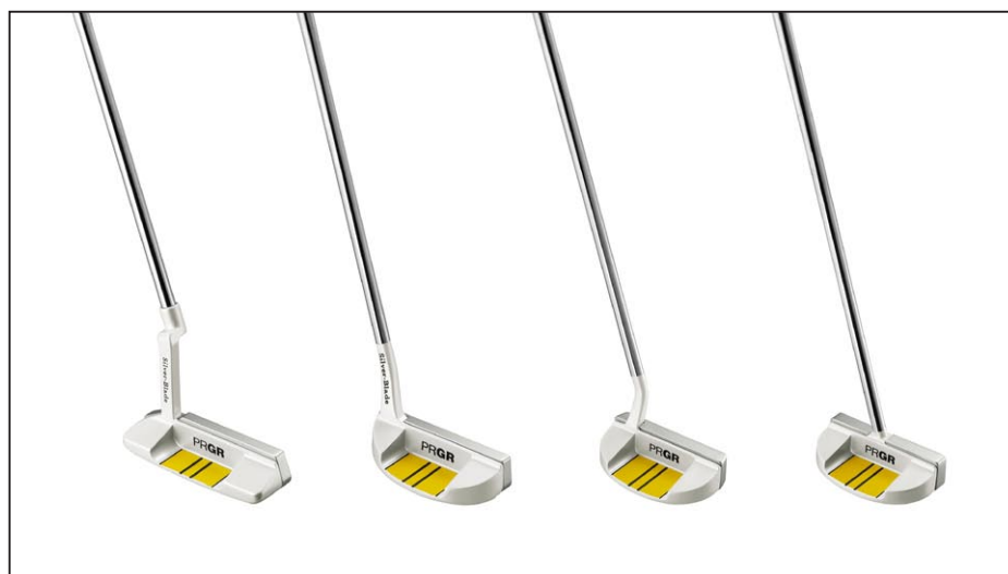
「Silver-Blade ZN」シリーズ 左から「SB-01ZN」「SB-02ZN」「SB-03ZN」「SB-03CSZN」

PRGRは現在、重めのヘッドで振り心地を追求しブラックカラーが特長の「Silver-Blade HB」シリーズをラインアップしている。今回、「Silver-Blade ZN」を追加することで、さらにパターシリーズの充実を図った。