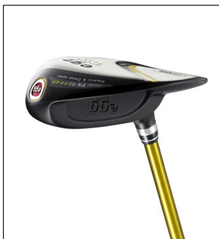
egg スプーン H・D