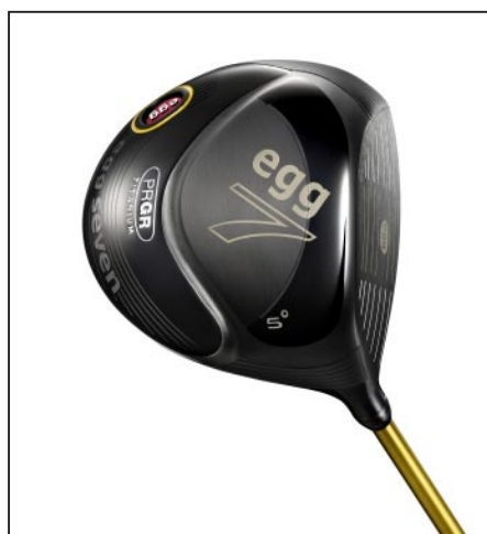
egg seven (5°モデル)