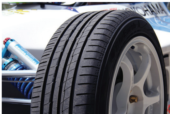
装着タイヤの「BluEarth-A」は優れた走行性能と低燃費性能を両立している