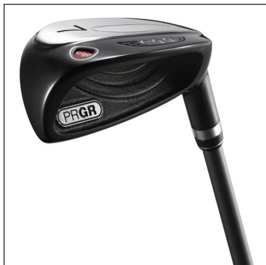
NEW egg IRON

「egg」シリーズは「既成概念にとらわれない」、「卵の殻を打ち破る発想」、「飛び、やさしさを最優先」をコンセプトに開発したクラブシリーズ。同時発売する長尺・軽量ドライバー「eggbird(エッグバード)」、新形状ユーティリティ「egg it+(エッグアイプラス)」とともに今までにない“やさしさ”と“飛び”を追求したシリーズとなっている。