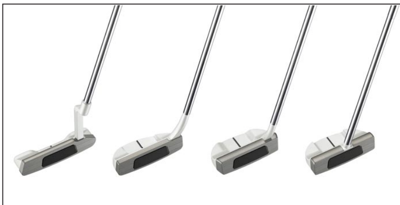
「Silver-Blade II s」シリーズ