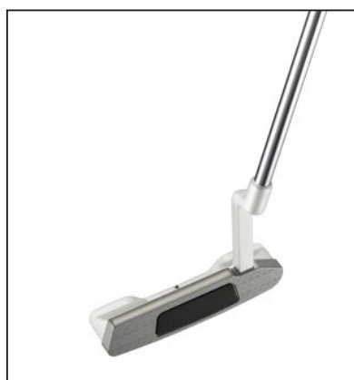
「SB II - 01s」

「Silver-Blade II s」シリーズはフェースインサート部に樹脂を使用し、ソフトでマイルドな打感を実現したのが特長。ヘッドはややシャープで上級者に好まれるデザインにしたほか、カラーはホワイトパールとした。現在PRGRは、フェースインサート部にミラー仕上げのステンレスプレートを使用し、ややしっかりした打感で銀と黒のツートンカラーが特長の「Silver-Blade II」シリーズを販売している。今後はソフトでマイルドな打感の「Silver-Blade II s」シリーズ、しっかりと打感の「Silver-Blade II」シリーズとラインアップを充実させ、多様なゴルファーのニーズに対応していく方針。