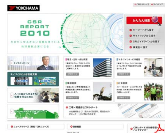
ウェブ「CSR（環境・社会）活動」のトップページ

このリリースに関するお問い合わせ先 横浜ゴム（株） 広報部 担当：菊地 TEL：03-5400-4531 FAX：03-5400-4570