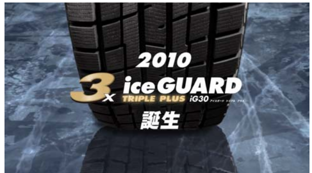
テレビCMのワンシーン