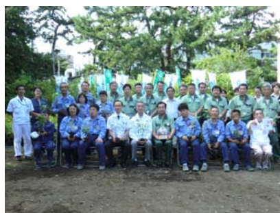
贈呈式出席者による記念撮影