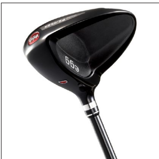
New 「egg スプーン」

「egg」シリーズは「既成概念にとらわれない」「卵(egg)の殻を打ち破る発想」「性能(飛び、やさしさ)を最優先に開発」をコンセプトに2007年9月から発売しているクラブシリーズ。2010年8月には、軟鉄鍛造アイアン「egg FORGED アイアン」もラインアップに加わる。