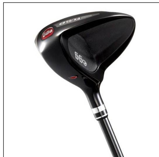
New 「egg フェアウェイウッド」