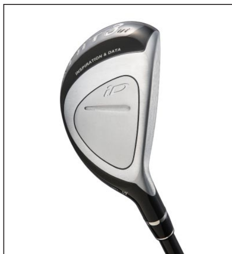
「iD HIT UT」