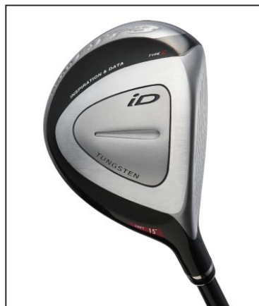
「iD HIT TYPE C」