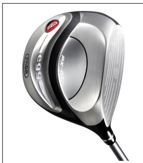
「egg impact PX-01」

「egg」シリーズは「既成概念にとらわれない」、「卵（egg）の殻を打ち破る発想」、「性能（飛び、やさしさ）を最優先に開発」をコンセプトにしたクラブシリーズ。打ちやすく飛距離がでることで、幅広いゴルファー層に支持されており、すでにスプーン、フェアウェイウッド（#5、7、9）、アイアンをラインナップしている。