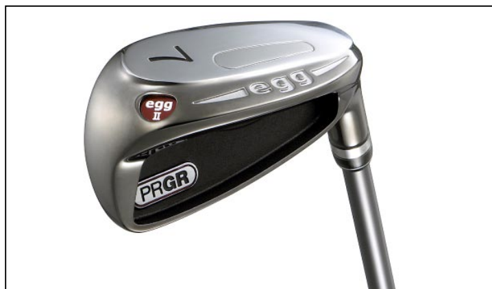
「egg アイアン II」

「egg」シリーズは「既成概念にとらわれない」、「卵（egg）の殻を打ち破る発想」、「性能（飛び、易しさ）を最優先に開発」をコンセプトに2007年9月に発売したクラブシリーズ。打ちやすく飛距離がでることで、幅広いゴルファー層に支持されており、これまでアイアン、スプーン、フェアウェイウッド（#5、7、9）をラインナップしている。