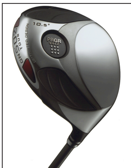
「GN 502 銀 TOUR ドライバー」

「GN 502 銀 TOUR ドライバー」は、「GN 502 銀」シリーズの「どんなゴルファーでも、カンタンに飛ばせるクラブ」といった基本コンセプトを生かしながら、しっかり叩いても捕まり過ぎずに飛距離が出る“やさしい”アスリート系ドライバー。ヘッドを「GN 502 ドライバー」に比べやや小ぶり（450cc）、重心角も5度小さめ（25°）としたほか、重心深度をやや浅く、実重心距離も短く設計した。さらにソール形状も浅重心をイメージさせるデザインを採用している。中先調子でコントロール性が良い専用シャフトは、高弾性カーボンシートをバット、チップに使用してトルクを抑え、走る、捕まるを両立させている。これらアスリート系を意識した設計によって、ハードヒッターでもフックを恐れずに、しっかり叩け、強い弾道のショットが打てるドライバーに仕上がっている。