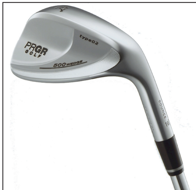
ヒール側からトゥ側へ流れるように肉厚を薄くした「500 WEDGE type02」のバックフェース

「500 WEDGE type02」は、“やさしさ” にコントロール性能を加えた軟鉄鍛造ウェッジ。フェースの顔ともいえるバックフェースの肉厚を、ヒール側からトゥ側へ流れるように薄くすることで、ボールコントロール性能の向上を図った。また前モデル(500 wedge)に比べ重心距離を短く設定し、ヘッドをやや小ぶりにしたこともコントロール性能向上に寄与している。フェース面は精密機械加工で、アベレージゴルファーから上級者まで安定したスピン性能が得られるようになっている。こうした様々な工夫によって、“強く柔らかい” ショットがイメージしやすいウェッジに仕上がっている。