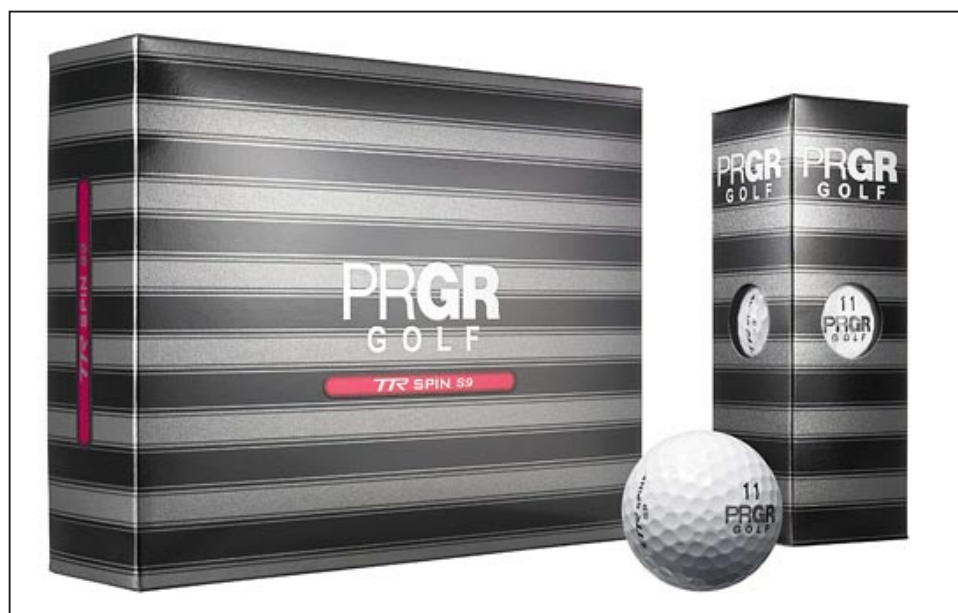
「TR SPIN S9」

男子ツアーで「TR SPIN」を使用するPRGR契約の矢野東、谷原秀人両選手も、2010年のツアーでは飛距離性能をプラスした「TR SPIN S9」を使用する予定のため、プロ使用ナンバー（矢野選手#76、谷原選手#7）ボールも同時に数量限定で発売する。