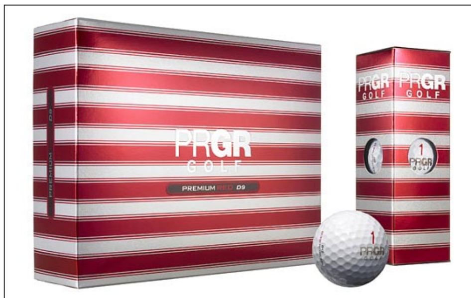
「PREMIUM RED D9」

「PREMIUM RED D9」は、あらゆる番手でソフトな打感と、高反発、高初速による飛びの性能を追求した従来品「PREMIUM RED」をさらに進化させたディスタンス系ボール。ボールのコアを柔らかくすることで、よりソフトなフィーリングを実現したほか、ドライバーでの高反発、低スピンを目指して中間層の「高反発プレミアムミッドカバー」を改良し、ショットの飛距離アップとウェッジでのスピン性能の向上を図った。識別ナンバーは、視認性が高く好評のビクナンバーを引き続き採用している。