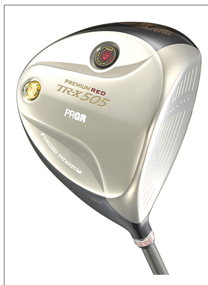
プレミアム・レッド TR-X505ドライバー

「新・赤鬼」シリーズはPRGRブランドの中で最も「高機能」、「プレミアム」をキーワードに開発した新商品群で、「新・赤鬼ドライバー」は最大飛距離を追求した新長尺ドライバー。飛距離アップの基本である低スピン・高弾道ショットを実現するため、クラブヘッドはソールバックを伸ばしたシャローバック形状、余剰重量を適正配置するためのクラウン部、トゥ部分のケミカルミーリング処理（化学的平削り）、上部を薄く下部を厚くした「ダブルチタンフェース」を採用し、徹底的な低深重心化を図った。またヘッドスピードアップに最も効果のあるシャフトの長尺化（46.5インチ）を図り、シャフトにナノテクノロジーで開発した新素材「フラーレン」を全周に配合、さらにミディアム・バット構造で軽量化としなり戻りを向上させ、長尺でも振り遅れず加速するシャフトに仕上げた。またスイング中の力みをなくしヘッドスピードを上げるため、グリップ力にすぐれた軽量（30g）グリップを採用。さらに使い心地にもこだわり、快音でソフトな打感設計とした。