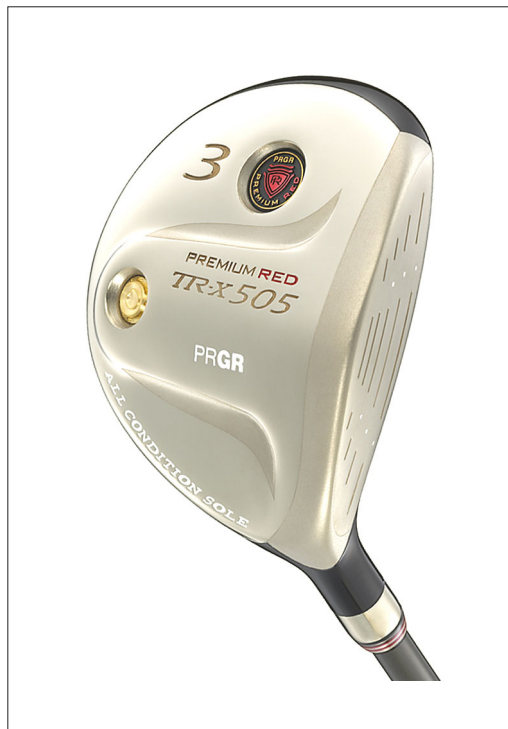
プレミアム・レッド TR-X505 フェアウェイウッド

「新・赤鬼」シリーズはPRGRブランドの中で最も「高機能」、「プレミアム」をキーワードに開発した新商品群で、「新・赤鬼フェアウェイウッド」は「飛びと易しさ」をテーマに開発したフェアウェイウッド。安心感と打ち易さを追求したシャローヘッドの採用や、フェアウェイのつま先上がり、つま先下がりなどあらゆるライに対応できるオールコンディションソール（V型ソール）によりショットの方向性が向上した。またチタンとステンレスの比重差を利用した低重心構造により、クリーンにボールを拾い易くした。さらにグリップ力に優れた軽量（30g）グリップ採用などの軽量化設計でヘッドスピードアップを図った。