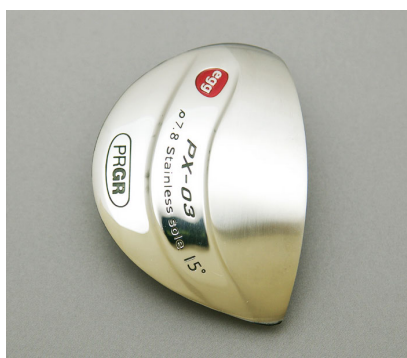
ステンレススチールSUS630ソール