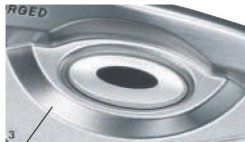
マグネシウム配合ワッペン