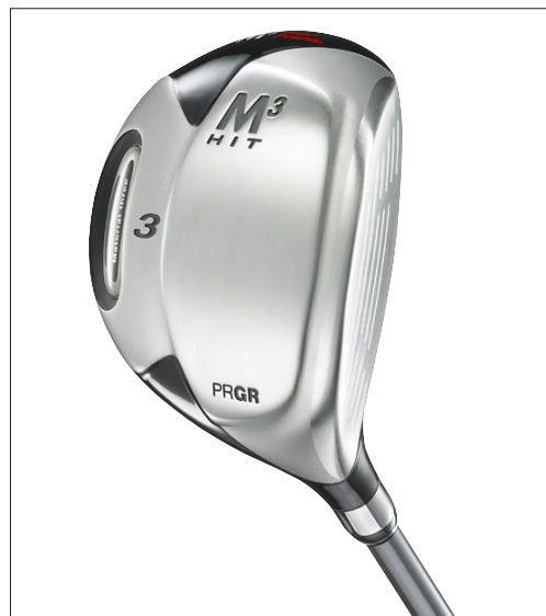
M 3 HIT ツアー

ヘッドスピードの比較的速いゴルファーの場合、大型ヘッドは、ボールが左に曲がったり、吹き上がる不安を与えることもあるため、「M 3 HIT ツアー」では、「M 3 HIT」に比べヘッドサイズを約15%縮小し、ライ角を2°フラットにした。これにより「M 3 HIT ツアー」は、「M-43」前後のセミハードヒッターがしっかり叩けて、簡単に飛ばせるフェアウェイウッドとなった。