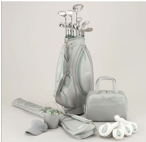
PRGR「SWEEP」シリーズのクラブとグッズ

グリップは、親指の位置を示すマーク付きで、初・中級者が毎回正しく握りながらスイングできる「コーチング・グリップ」（ツアープロコーチ内藤雄士氏監修）を装着した。またヘッド設計は、各番手ともボールが上がり、飛距離が出しやすい「低重心スイープヘッド」を採用。さらにシャフトは、自然にしなりボールをはじく「NEWスプリングシャフト」を専用設計した。しかもファッショナブルで高級感のあるデザインを取り入れ、楽しく、華麗に、気持ちよくプレイできるクラブとなっている。