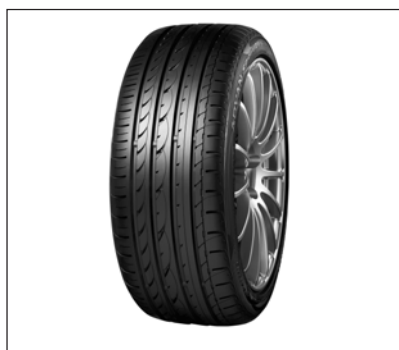
スポーツ系ランフラットタイヤ 「ADVAN Sport Z・P・S」

横浜ゴムは「ADVAN」を当社のグローバル・コンセプトを象徴するフラッグシップ・ブランドとして2004年から世界中で積極展開している。「ADVAN」はそのハイパフォーマンス性やハイクオリティ性が認められ、世界有数の高性能車に新車装着されているほか、モータースポーツ分野でも「FIA世界ツーリングカー選手権（WTCC）」のコントロールタイヤに認定されている。