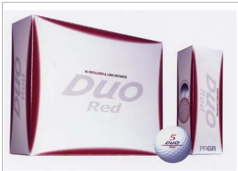
DUO Red ボール

「DUO Red ボール」の発売により、PRGRゴルフボールは、昨年発売された「TR-X Power & Soft」、今回同時発売の「TR-X Soft Blue」と合わせて3系列が揃い、ゴルフスタイルに応じて「飛び」が選べるラインナップとなった。