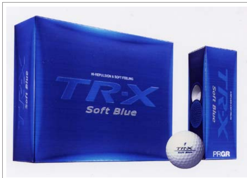
TR-X Soft Blue ボール

「TR-X Soft Blue ボール」の発売により、PRGRゴルフボールは、昨年発売された「TR-X Power & Soft」、今回同時発売の「DUO Red」と合わせて3系列が揃い、ゴルフスタイルに応じて「飛び」が選べるラインナップとなった。