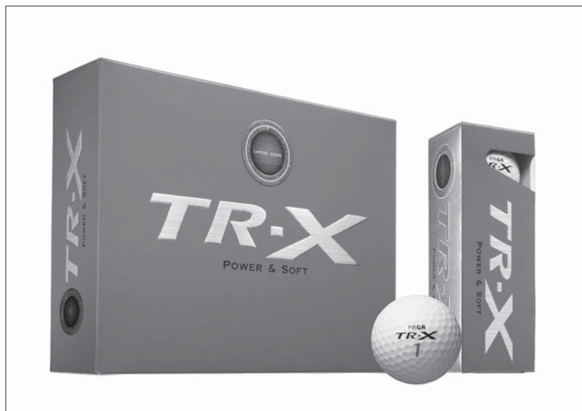
TR-X POWER & SOFT

「TR-X POWER & SOFT」は、高打ち出し、低スピンの弾道が得やすい最近のドライバーに最適で、さらなる飛距離アップが実現できる。ヘッドスピード43m/s以下の飛距離志向のゴルファーが気持ちよく使えるボールとなっている。