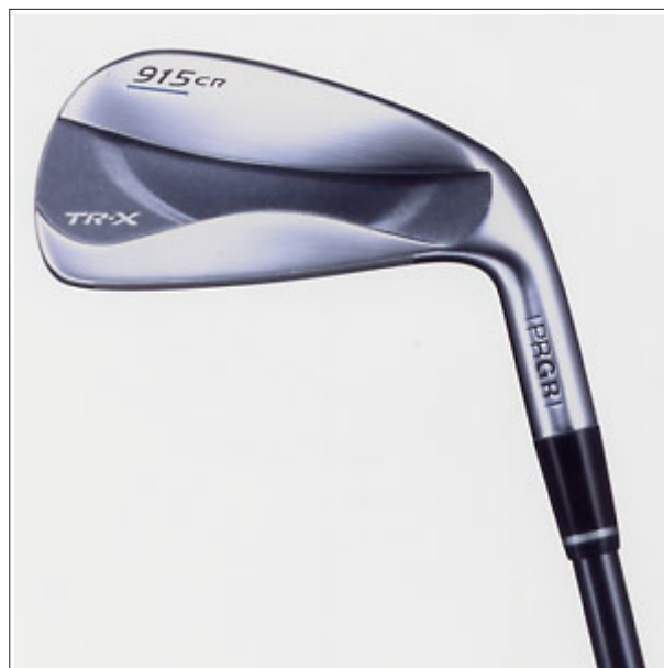
「TR-X 915 CR」

「TR-X 915 CR」は、同時発売のドライバー NEW「TR-X DUO」（デュオ・ブルー）に対応するアイアンセット。「TR-X 915 CR」の発売で、「TR 910 FORGED」「TR-X 925 CR」と合わせて、幅広い層のゴルファーに対応できるPRGRの新「900シリーズ」のラインナップが完成した。