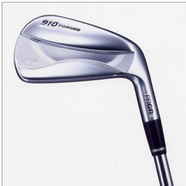
「TR 910 FORGED」

「TR 910 FORGED」は、同時発売のドライバーNEW「TR DUO」（デュオ・ブラック）に対応するアイアンセット。「TR 910 FORGED」の発売で、「TR-X 915 CR」「TR-X 925 CR」と合わせて、幅広い層のゴルファーに対応できるPRGRの新「900シリーズ」のラインナップが完成した。