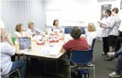
Weight Watchers (栄養士によるダイエットの推進活動)