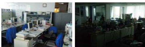
午休时间完全关闭照明电源的状态（左：关闭照明前、右：关闭照明后）

5 月 1 日-10 月 31 日期间，导入清凉商务活动，在午休时间完全关闭照明电源。计划于 2009 年 8 月开始，实施每月一次利用电车及公共汽车通勤的“无私车日”，设定集体定时下班日。