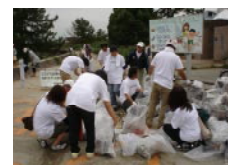
御殿場海岸の清掃活動風景

2008年5月に開催された三重工場植樹祭に従業員27名が参加したほか、同年6月に三重県津市御殿場海岸の清掃活動に従業員92名が参加し、その模様が三重テレビ放送・津ケーブルテレビのニュース番組内で紹介されました。