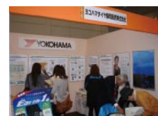
ヨコハマタイヤ静岡販売(株)の出展ブース

2008年11月に静岡県主催の「第6回しずおか環境・森林フェア」に出展しました。ブースにはエコタイヤ「DNA Earth-1」、トラック・バス用エコタイヤ「ZEN」などを展示したほか、従業員の手作りのタイヤ名称当てクイズを行い、来場者を楽しんでいただきました。また、2008年7月、静岡出光会主催の三保の松原海岸清掃活動「クリーンアピール」に従業員27名が参加しました。