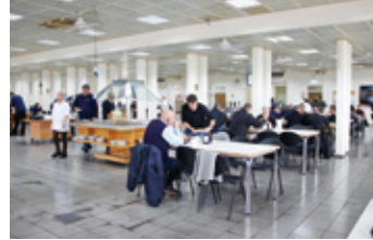
厚生施設：食堂の様子とメニュー例