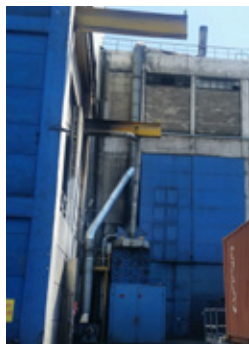
セメントハウス（ゴム揮：有機溶剤）の排気口の改善

有機溶剤や化学物質を取り扱う機器を改善しました。また天然ガス機器を更新し、CO 2 排出削減を進めています。