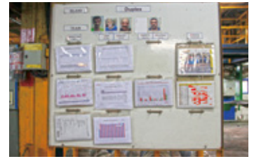
業務進捗の管理ボード (安全・品質など)