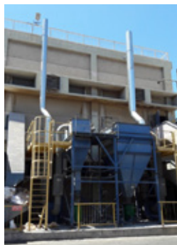
化学物質使用機器の排気口の改善