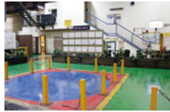
作業前にミーティングサークルで注意事項を確認

各職場は、該当する全ての州の健康要件および安全衛生規則に従って運営され、違法薬物、アルコール、または規制物質の影響を受けないようにします。そのため、薬物、アルコール、または規制物質の所有、使用、販売、購入、移転、またはあらゆる種類の取引を禁止しています。各取締役および従業員は、適用法、本規範、および「職場における安全」に関する規則を順守し、安全で健康的な職場を維持する責任があります。