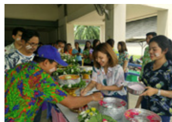
ソンクランの行事