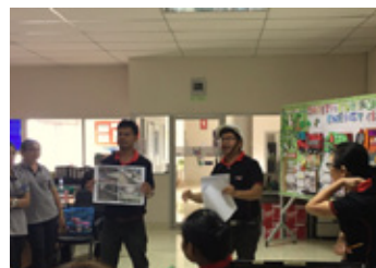
Safty・Environment・Energy (SEE) 活動