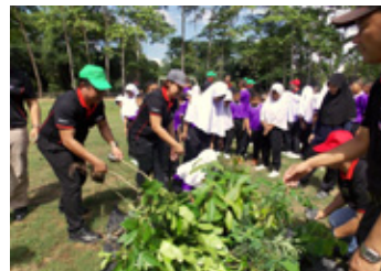
グリーンウェブ活動 (近隣の小学校にて植樹)

また、調整池の周囲に植樹や護岸を整備し、鳥や魚が住みやすい環境整備にも着手しました。