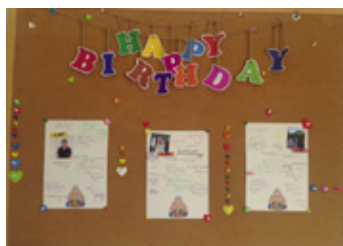
誕生日のメッセージボード

タイの仏教文化に基づいたイベントや、誕生日会、年末パーティー、従業員の結婚式などさまざまな場面でタイ人・ミャンマー人・日本人が交じり合い、異文化交流・親睦を図っています。