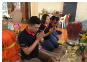
誕生日 (お寺での祈願)