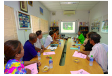
農家を招いての勉強会(アグロフォレストリー農法)