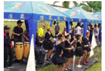
近隣企業とのサッカー大会への参加