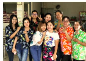
ソンクランの行事