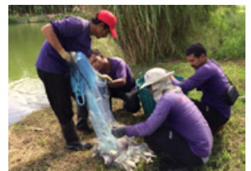
池の生態調査 (生物多様性保存活動)