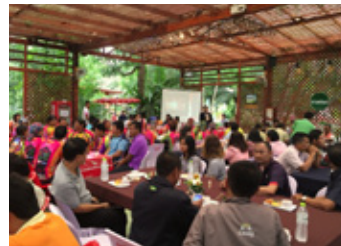
近隣企業との定例会議