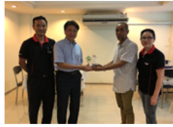
原料サプライヤーの表彰

また、大学でアグロフォレストリー農法を研究している専門家と協力し、Y.T.ラバーが展開する試験農園への苗木の提供を行っています。