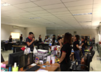
始業前の安全唱和

政府が主導する禁止薬物撲滅運動にも積極的に協力し、従業員の健康と健全な生活環境の維持に努めています。